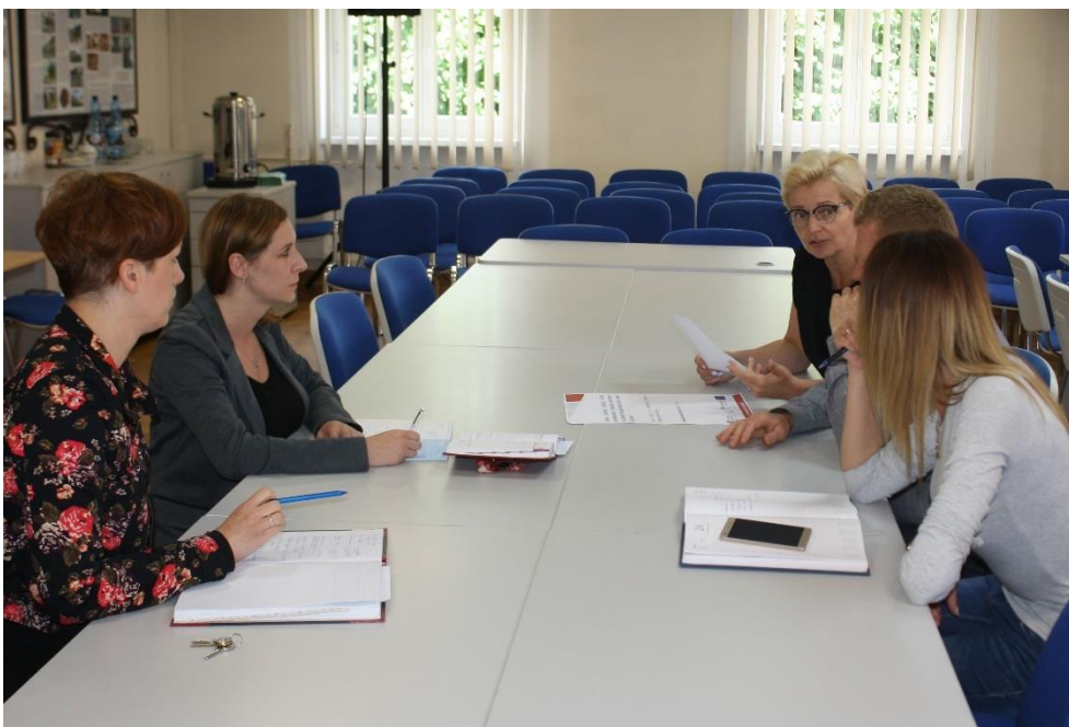
Fot. 9: Zespół Zadaniowy przy pracy nad programem rewitalizacji