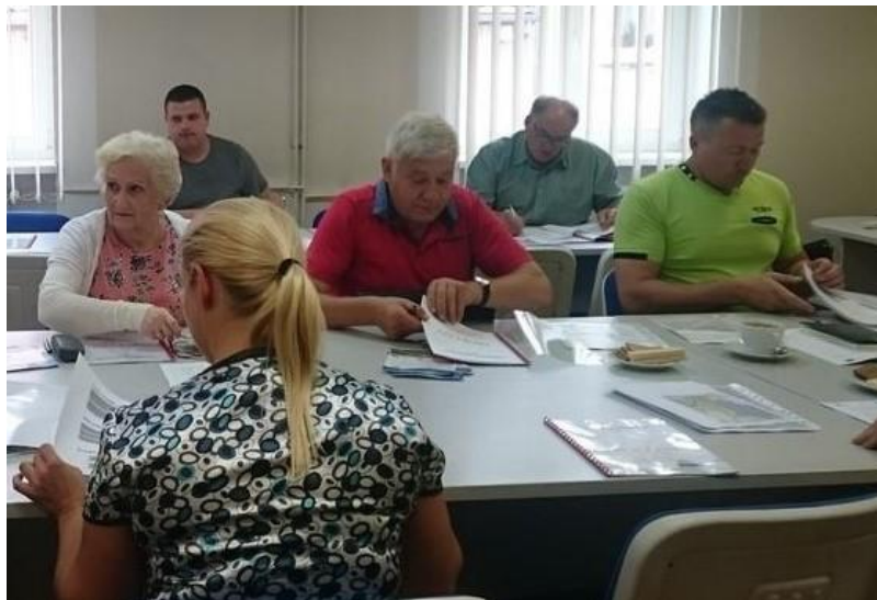
Fot. 3: Partycypacja pasywna - badanie audytoryjne, 9 sierpnia 2017 r.

Otwarte spotkania dyskusyjne, badanie audytoryjne, ankieta kwestionariuszowa, spacery studyjne, badania terenowe (wywiady niestrukturalizowane), zbieranie uwag i opinii drogą pisemną lub elektroniczną.