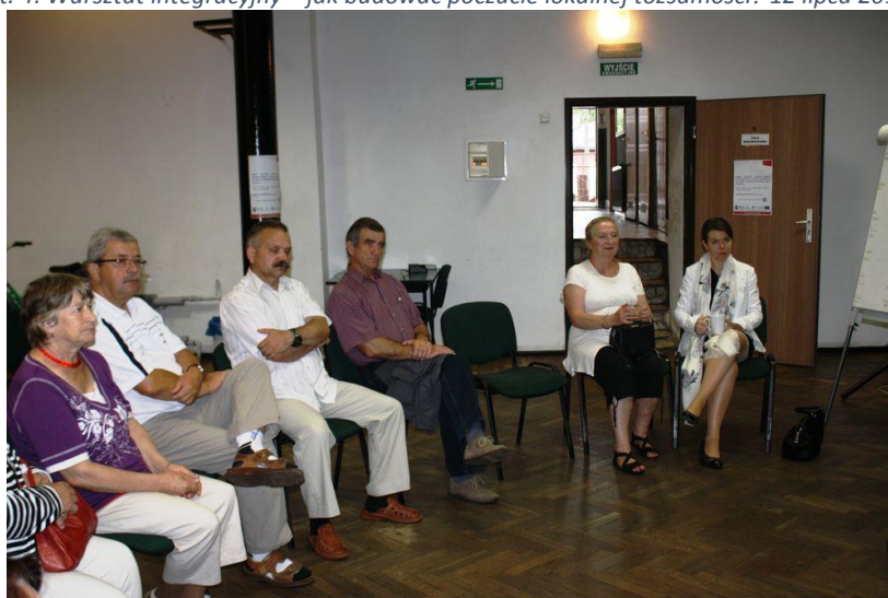
Fot. 4: Warsztat integracyjny – jak budować poczucie lokalnej tożsamości? 12 lipca 2017 r.

Warsztaty integracyjne, warsztaty kreatywne dla dzieci i młodzieży 4 , szkolenie - poradnictwo dla potencjalnych projektodawców (mobilizacja do aktywnego uczestnictwa w procesie zmian),