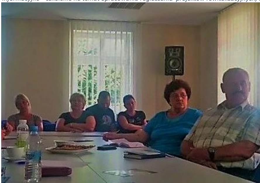
Fot. 5: Spotkanie informacyjne – szkolenie na temat opracowania i zgłaszania projektów rewitalizacyjnych, 18 sierpnia 2017 r.