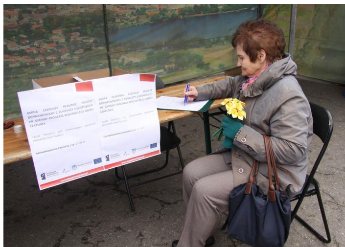
Fot. 8: Diagnozowanie problemów i potrzeb rewitalizacyjnych – stoisko GPR podczas Jarmarku, badanie ankietowe interesariuszy rewitalizacji (źródło: UM w Czaplínku).